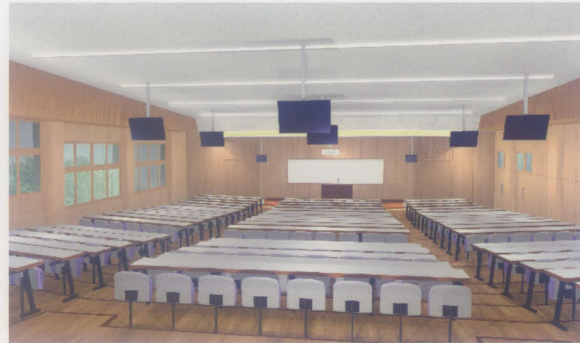
設置を予定するホール等のイメージ

学部の枠を越え、大学の枠も越えた幅広い人々が集う場所として、新棟の建設を予定しています。女子学生向け更衣室やパウダールームを始め、イベントや講義などを行うホール等の設置を検討中です。