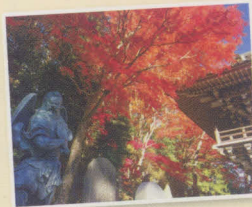
高尾山薬王院 山門、大天狗